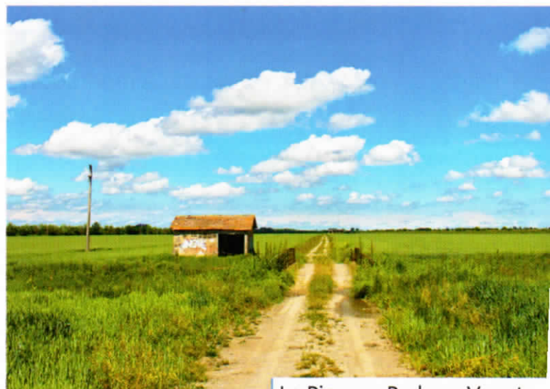
La Pianura Padano-Veneta.

Le ceneri di antichi vulcani hanno formato la Pianura Campana nel corso del tempo. Queste ceneri hanno reso il terreno ricco di sostanze utili per le piante, infatti la Pianura Campana è molto fertile.