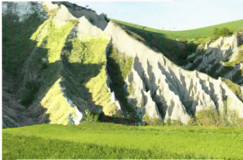
Calanchi sulle colline abruzzesi. I solchi diventano più profondi con il passare del tempo.