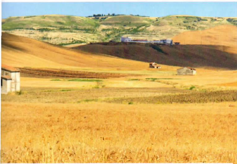
Le Murge, tra Puglia e Basilicata, sono un altopiano, cioè un territorio pianeggiante sopra i 200 m.

Le colline sono diffuse su tutto il territorio italiano e per questo motivo appartengono a più zone climatiche . Tuttavia hanno degli elementi climatici in comune: in primavera e autunno piove molto, mentre il resto dell'anno il clima è secco, ventilato in estate e mite in inverno.